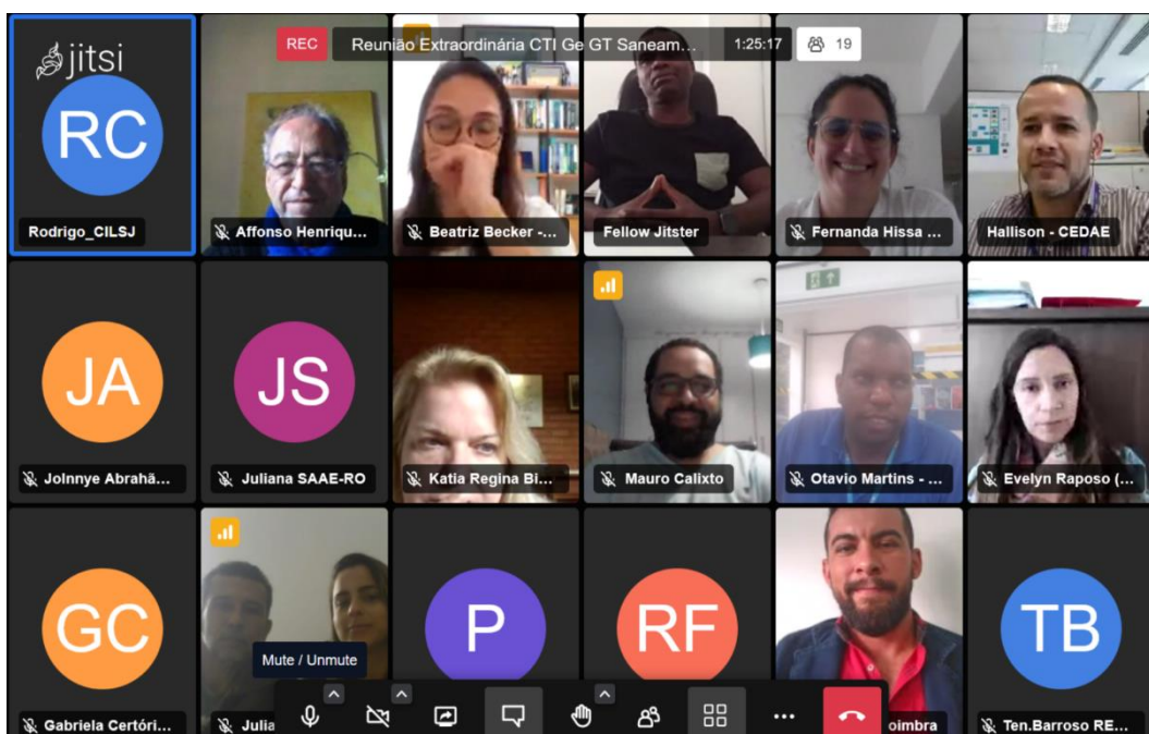
Figura 1: Registro da reunião CTIG e GT Saneamento, em 30 de Agosto de 2022

Não havendo mais nada a tratar, os presentes agradecem e a reunião se encerra.